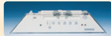
R80 PDE. Dubbel elektronisk termostat med inbyggt tidur med sju fasta veckoprogram. E-nr 85 290 06.