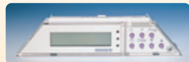
R80 UDF. Dubbel elektronisk termostat med inbyggt tidur med tolv fasta program samt möjlighet för programmering av eget värmeprogram. E-nr 85 290 30.