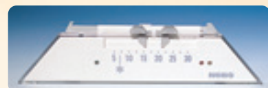
R80 ZDC. Dubbel elektronisk termostat för variabel sänkning styrd via separat styrledning. E-nr 85 290 04.